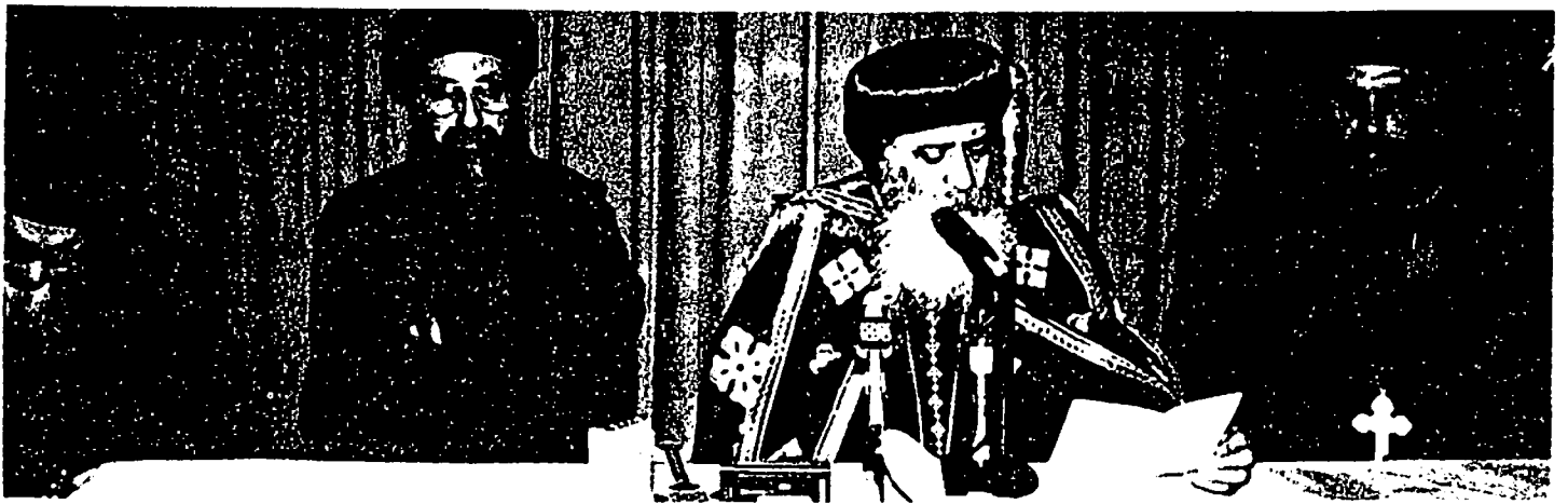
قداسة البابا شنودة الثالث في المؤتمر الصحفي