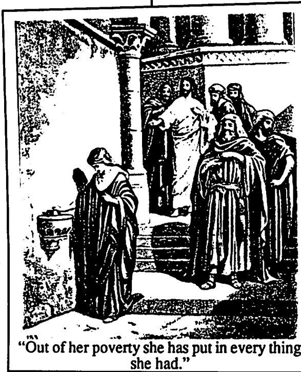
“Out of her poverty she has put in every thing she had.”

“And He sat down opposite the treasury, and watched the multitude putting money into the treasury. Many rich people put in large sums. And a poor widow came, and put in two copper coins, which make a penny. And he called His disciples to him and said to them: Truly, I say to you, this poor widow has put in more than all those who are contributing to the treasury. For they all contributed out of their abundance; but she out of her poverty has put in everything she had, her whole living”(Mark 12:41-44). There is no sacrifice if we give our leftovers or if we seek recognition by others.