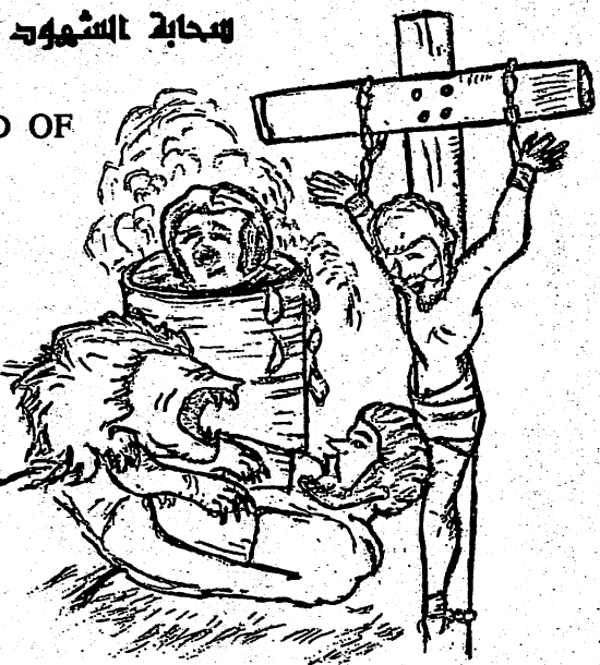
They were tortured, not accepting deliverance..... (Hebrews 11:35)