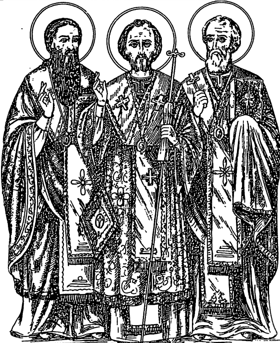
BASIL ❖ CYRIL ❖ GREGORY