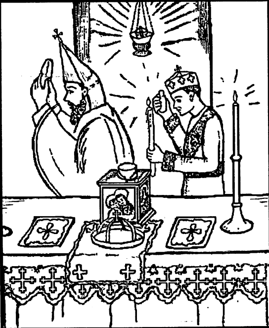
Going around the Altar, holding the offering above their heads.