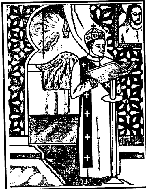
A Deacon Reads The Pauline Epistle