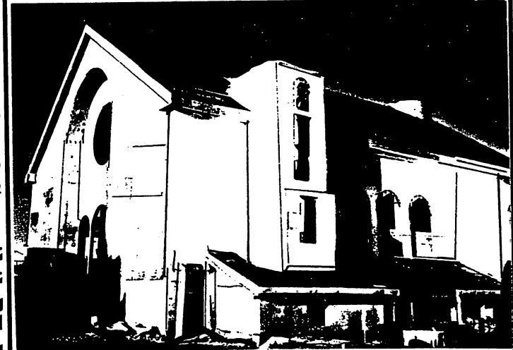
80% of the exterior structural work has been finished.

✦ اما بخصوص اعمال الفيبر جلاس الجارى تصنيعها بمصر فانها تسير على وجه مرضى ولكن نظراً لظروف غير متوقعة تأخر شحنها مدة شهر واحد. وسوف يتم شحن القيب والابراج واعمال الجرانيت قريباً جداً. اما عن حامل الايقونات والمقاعد فسيتم شحنها قبل نهاية العام. صلوا بخبرة والرب سوف يتمجد.