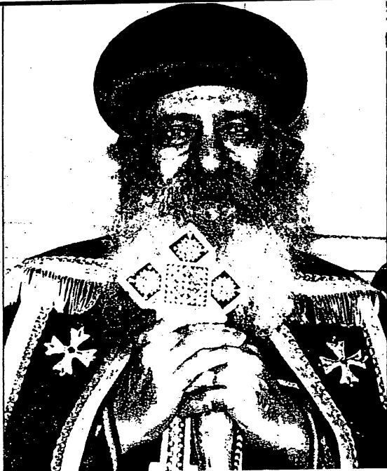
H.H. Pope Shenouda III Pope of Alexandria and Patriarch of the See of St. Mark.