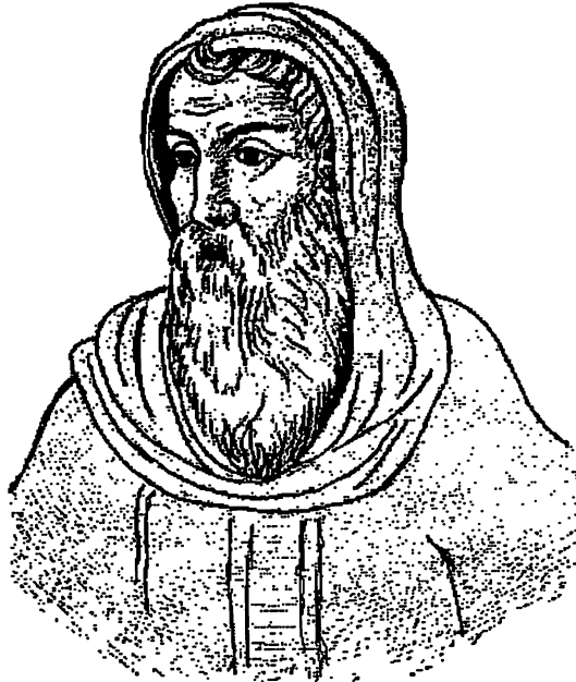
القديس اثنا سيوس الرسول بطل الأرثوذكسية العجا

في اليوم الخامس عشر من شهر مايو (٢٤ برمودة) تحتفل الكنيسة بتذكار نياحة القديس اثنا سيوس الرسول بطل الأرثوذكسية العظيم وحامي الايمان المستقيم.